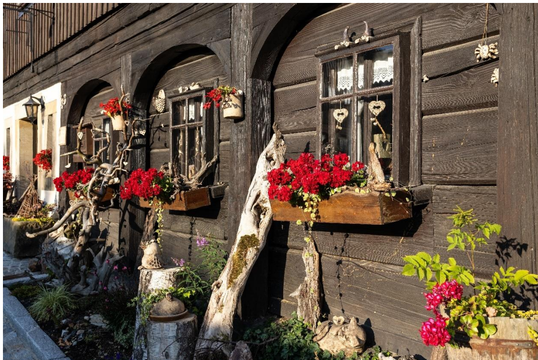
Entlang des Oberlausitzer Bergwegs kann man einzigartige Umgebendhäuser entdecken, Foto: Mario Kegel