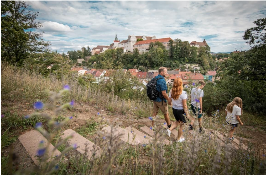
Der neue Podcast gibt spannende Ausflugstipps für den nächsten Familienurlaub

Das „Reise Radio“ startet spannende Staffel über die Region