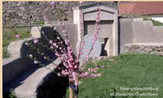
Felsengrabbachbildung im Bibelgarten Oberlichtenau

Der Bibelgarten Oberlichtenau-Pulsnitz ist ein Freilichtmuseum mit der Atmosphäre des biblischen Israels. Am Schlosspark 2 | D-01896 Pulsnitz OT Oberlichtenau Telefon +49 35955 45888 Telefax +49 35955 40006 incoming@evangtours.de www.bibelgarten.de