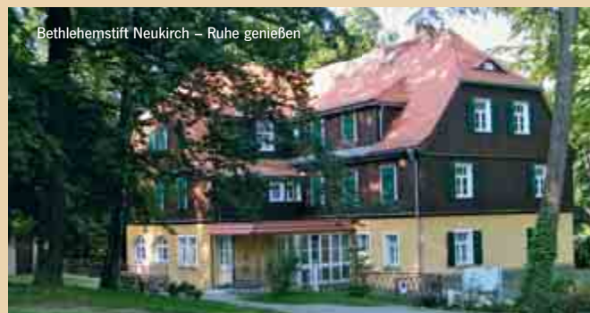
Betlehemstift Neukirch – Ruhe genießen