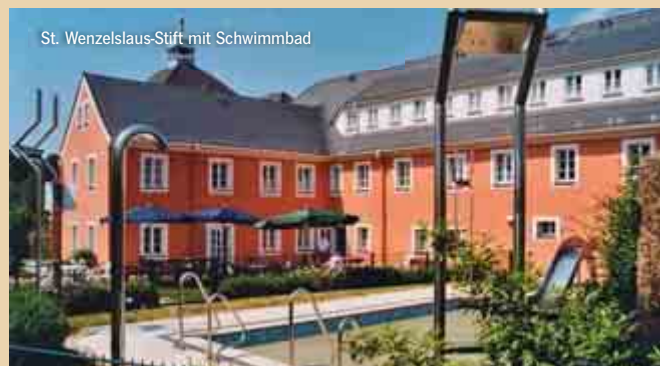
St. Wenzeslaus-Stift mit Schwimmbad

st-wenzeslaus-stift@bistum-goerlitz.de | www.st-wenzeslaus-stift.de